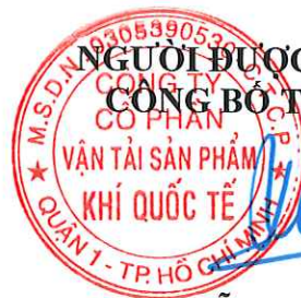
Đỗ Đức Hùng